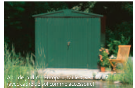
Abri de jardin « Europa », taille 3, vert foncé (avec cadre de sol comme accessoire)