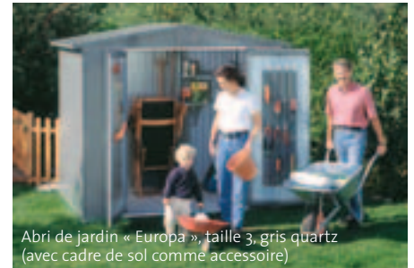
Abri de jardin « Europa », taille 3, gris quartz (avec cadre de sol comme accessoire)