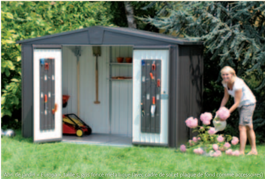
Abri de jardin « Europa », taille 5, gris foncé métallique (avec cadre de sol et plaque de fond comme accessoires)